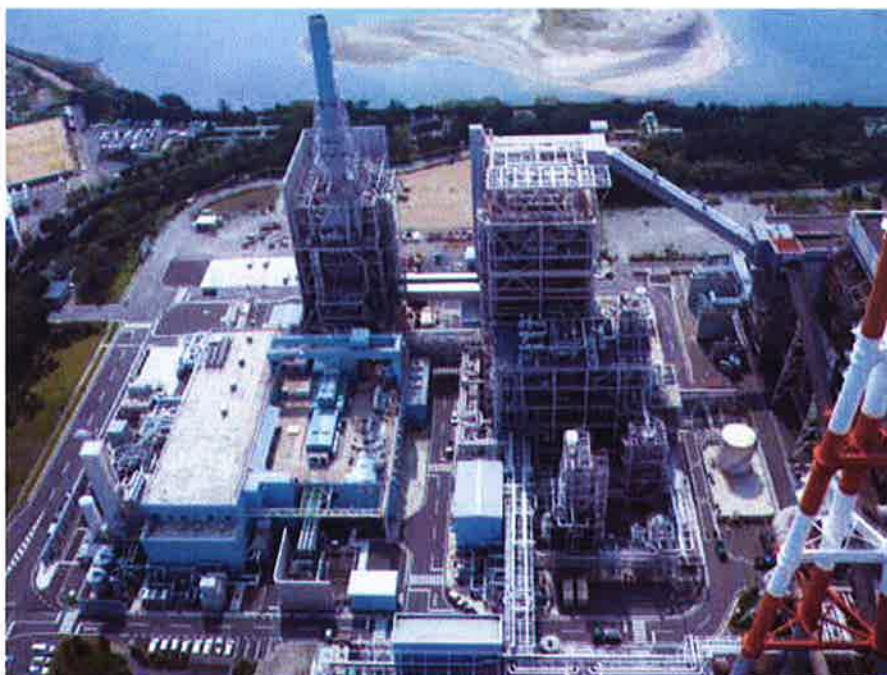
図1. 実証機完成写真

建設期間中に、想定外の事象に見舞われたが、工事日数1,025日、延べ作業員数33万8千人の無事故・無災害による工事の後、平成19年9月20日にガス化炉点火を行い、実証機建設が完了した(図1参照)。